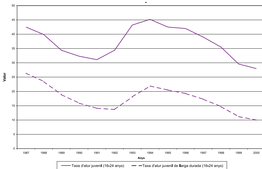
Gràfic 1. Taxa d'atur juvenil (16-24 anys), per durada. Catalunya